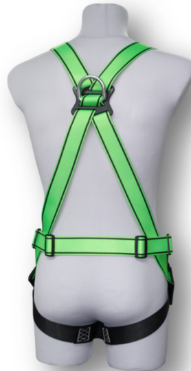
Abb. MB95-E Rückseite