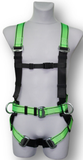
Abb. MB95-E Vorderseite

gepr. nach EN 361:2002 und EN 358:2000-2 mit integrierter Haltefunktion