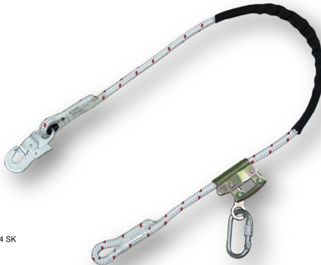
Abb. MASI MB4 SK